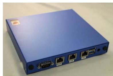
Contegos safe connect Appliance

In Kooperation mit KOBİK (Koordinationsstelle zur Bekämpfung der Internetkriminalität) entwickelt.